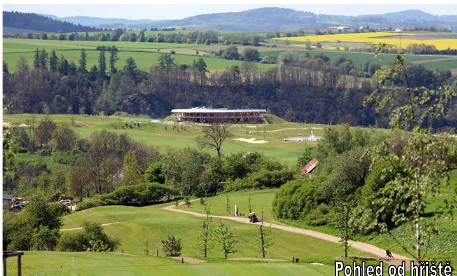
Pohled od hřiště