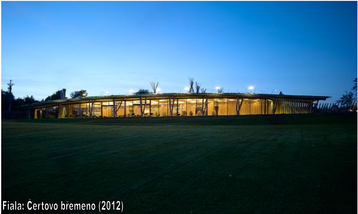
Fiala: Čertovo břemeno (2012)

Zde však srubový, až bambusový charakter stěn a z opravdových rozeklaných stromů vytvořené sloupy ve tvaru V vytvářejí autentické prostředí, které nezaměníte s ničím jiným. Může si tak dovolit žádným detailem neodkazovat na golf a s ním spojené motivy.