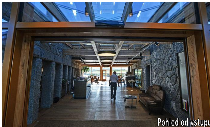
Pohled od vstupu