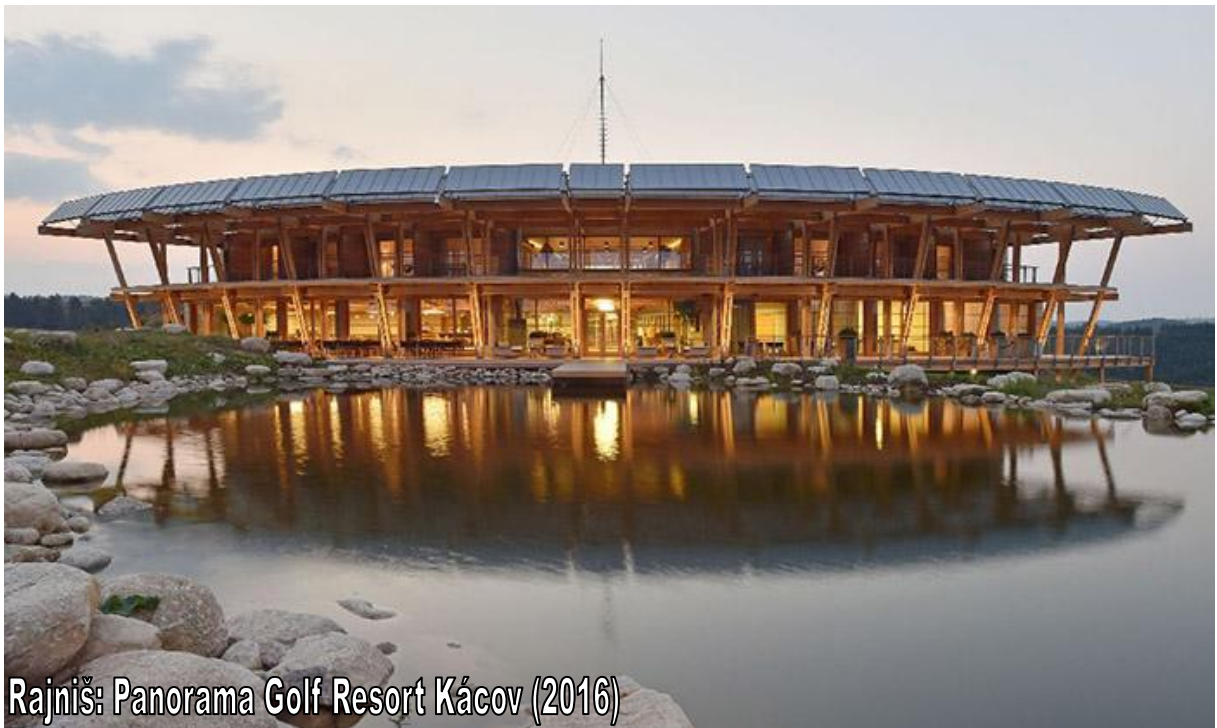
Rajniš: Panorama Golf Resort Kácov (2016)

To Rajniš si pomáhat musí. Ať už jde o detail, jako vnitřní vybavení, tak ale i v samotném konceptu. Slyšeli jsme ho, jak obří golfista zanechává stopu na hřišti a vroubkování podrážky vytváří objemovou skladbu celého projektu. Můžeme to pokládat za prvoplánové? A je to vůbec z nadhledu tak poznat? A co fasáda? Konkávnost a horizontalita ve spojení s řadou nakloněných sloupů terasy a samotné hřiště, které pohled obklopuje, vytváří totožný estetický cíl a architekturu, kterou vytváří fasáda druhé zmíněné klubovny.